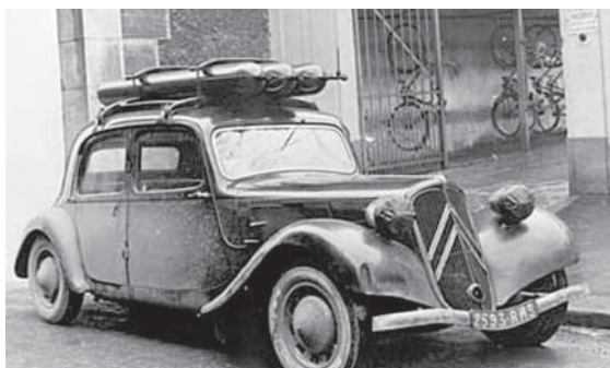
Auto a gasogeno con il buco per la manovella

Nel 1935 “per allungare lo stivale fino all’Africa Orientale” dichiariamo guerra al Negus, Re dei negri di Abissinia, che scappa subito in Inghilterra. Io, di negri a Cortona non ne ho