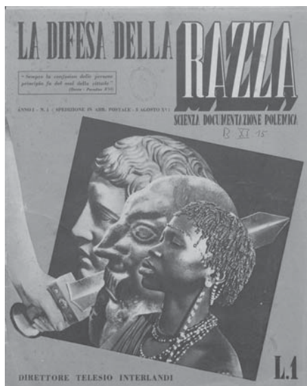
Rivista fascista "La difesa della razza"

e Gomorra di cui a volte sento parlare, ma non saprei dire cosa fanno.