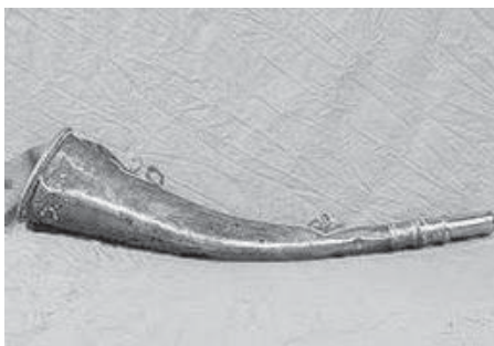
La trombetta dello spazzino

In campagna, ai bambini piccoli mettono le fasce avvolte strette, strette dai piedi fino al petto e la mamma, che è farmacista, dice che per questo molti bambini