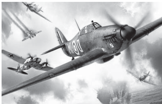
La battaglia d'Inghilterra

la guerra, ma non hanno l'età e i genitori li riacciuffano in tempo. La marchesina con il cognome altisonante, invece, scappa con l'autista, ma i genitori non fanno in tempo a riacciuffarla e i due si dovranno sposare.