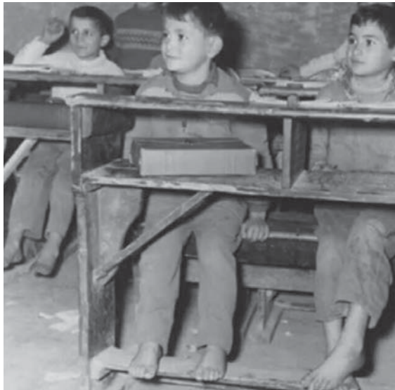
A scuola a piedi nudi

Però a Cortona ci sono anche molti benestanti, possidenti che