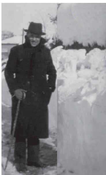
La neve a Cortona

L'anno successivo ci trasferiamo in una casa senza terrazza,