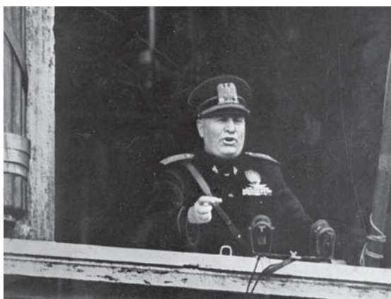
Il Duce proclama la guerra

Adesso il duce proibisce il saluto con la stretta di mano, perché dice che è una mollezza anglosassone da abolire; il saluto invece, va fatto con il braccio alzato. Poco dopo, Hitler in-