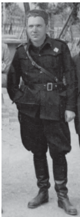
Il babbo in divisa fascista

Intanto noi italiani abbiamo preso l'Albania senza nemmeno dichiarargli la guerra, ma, si dice in giro, con valigiate di soldi distribuiti da Ciano alle massime autorità albanesi. Su Ciano i ragazzi più grandi cantano: "Ciano Galeazzo Conte di Cortellazzo, fa rina in amo, ma viene meglio in azzo". Il re è chiamato "sciaboletta" perché dicono che gli è stata fatta apposta la sciabola più corta perché quella normale gli strusciava per terra; ma diventa lo stesso Imperatore d'Albania. Si dice anche che il re sia molto sospettoso degli Aosta che sono tutti altissimi, e ha pau-