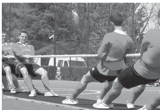
Il tiro alla fune

Ma i grandi dicono che Ciano e Balbo non sono d'accordo e che a loro non andrà per niente bene. Il duce decide che gli italiani devono usare il "Voi" e alla rivista "Lei" gli tocca cambiare il nome in "Annabella". Il babbo fa appendere un grande VOI al centro del soffitto del corridoio della scuola. Adesso si