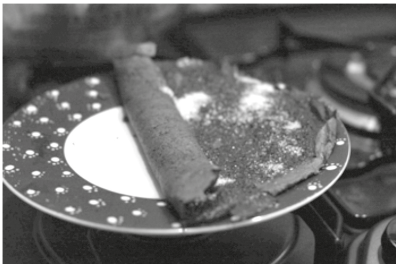
Il migliaccio "roventino"

Il gestore indossava un lungo grembiule bianco e serviva in maniche di camicia, anche d'inverno, poiché una potente stufa a carbone manteneva sempre là dentro una temperatura gradevolmente elevata. Tra i cibi reperibili nell'osteria c'erano i migliacci, portati in piatti di terracotta un po' sbreccati, mentre ancora fumigavano, spandendo l'odore del formaggio pecorino che li guarniva. Per chi non lo sapesse, spiegheremo che il migliaccio è una specialità toscana, particolarmente in uso nelle zone intorno a Firenze, consistente in sangue di maiale rappreso in padella fino a formare delle frittatine che possono essere servite aperte o modellate a forma d'involtoni, in ogni caso ben calde tanto da meritare il nomignolo di roventini.