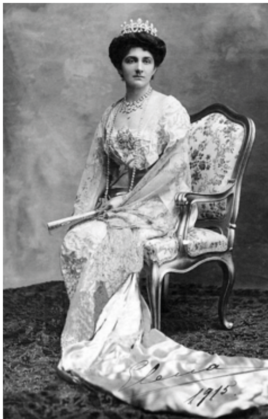
Elena del Montenegro

Tutti conoscono, crediamo, quel triste episodio, nato da un desiderio di vendetta, generoso nelle motivazioni quanto sinistro nell'esecuzione, che confermò, agli spiriti pensosi, come violenza generi violenza innescando la brutta catena delle ritorsioni. Il nuovo re Vittorio, piccolo e mingherlino a fianco della giovane sposa balcanica, iniziò così, in mezzo ad un lutto, il suo regno.