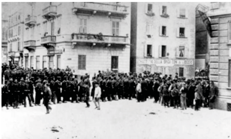
Milano: la repressione di Bava Beccaris

Questi momenti della nostra vita nazionale, che sulle pagine dei libri di storia sono descritti dalla limitata potenza delle parole, e sono racchiusi in frasi, spesso di maniera, che la virtù evocativa del lettore deve riempire di immagini, di moti e di sentimenti, furono, dinanzi ai sensi e all'intelletto di coloro che vissero ad essi contemporanei, cronaca palpitante. Certo, allora non c'erano i teleschermi a portare nelle case l'immediatezza delle riprese visive, e tutta l'informazione era diffusa dai giornali. Così io mi figuro il nonno, come tanti altri, intento a sfogliare il quotidiano, e mi sembra di ascoltare la sua voce che commenta le notizie o nella cerchia domestica o tra gli amici, quando, liberi dagli impegni del servizio e del lavoro, si ritrovavano al caffè o all'osteria e trascorrevano qualche ora di riposo tra i sigari e i bicchieri di vino. Il caffè era